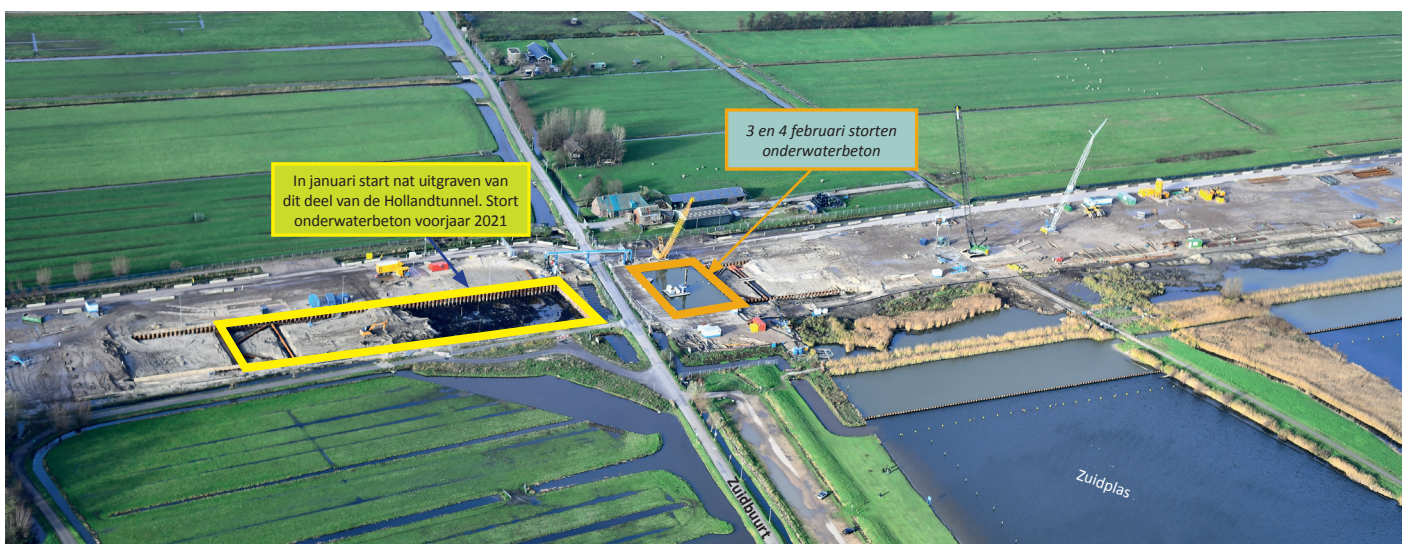
Afbeelding 1 locatie werkzaamheden Hollandtunnel

Het compartiment aan de andere kant van de Zuidbuurt staat inmiddels ook vol water (zie afbeelding 1). We zijn begonnen om ook dit deel van de tunnel nat uit te graven. In het voorjaar stortten we hier onderwaterbeton. Omdat dit een groter compartiment is, gaat deze stort ongeveer 45 uur aaneengesloten door. Hierover ontvangt u te zijner tijd meer informatie.