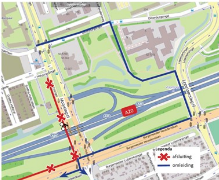
Afbeelding 2 - Afsluiting fietspad westzijde Holysingel ter hoogte van A20 en fietspad noordzijde Burgemeester Heusdenslaan en omleidingsroute