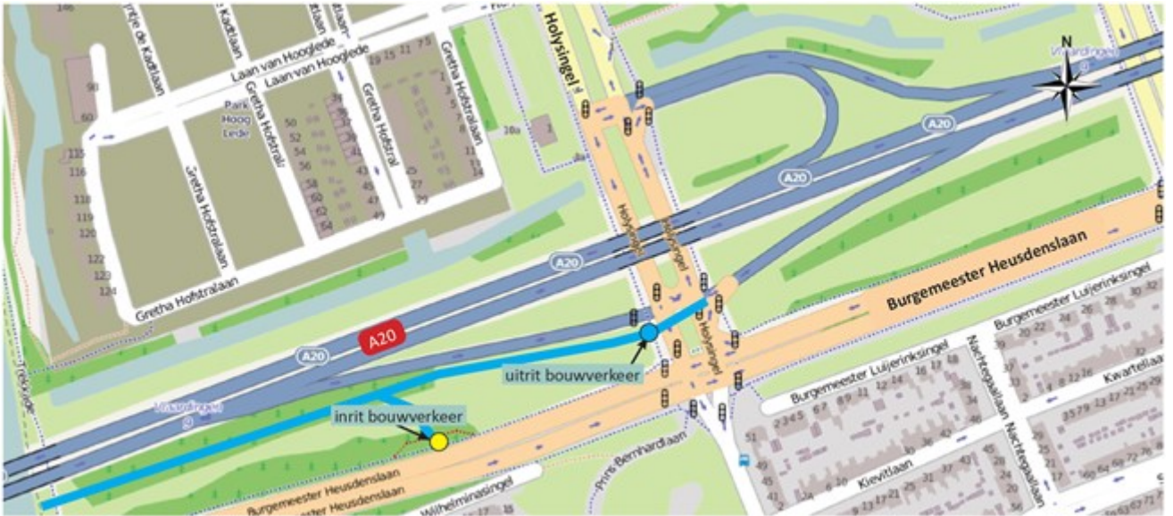
Afbeelding 1 Locaties in- en uitritten werkverkeer bij Holysingel