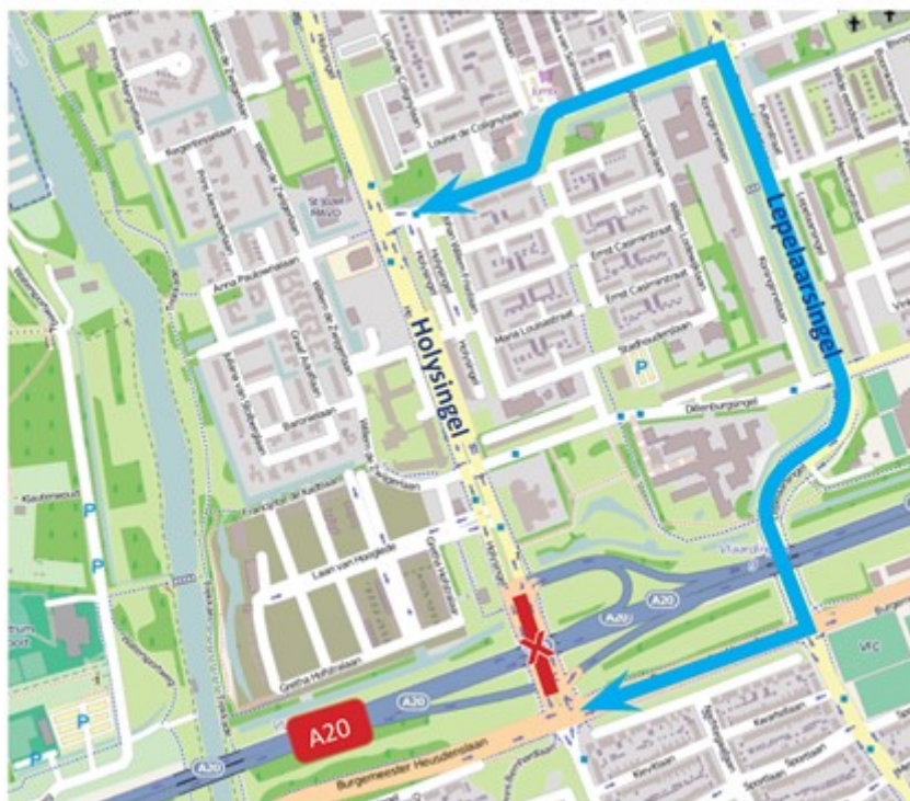
Afbeelding 4 - Omleidingsroute afsluitingen Holysingel voor autoverkeer