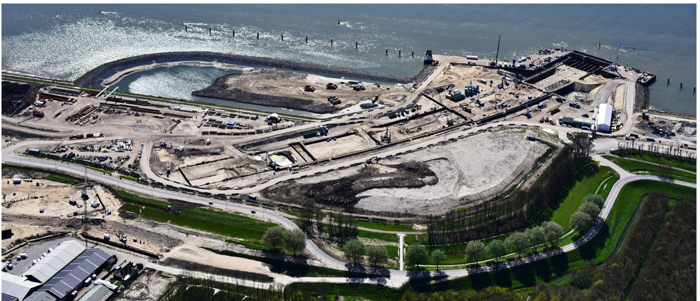
Afbeelding 2 Bouwkuip Maasdeltatunnel in Vlaardingen (foto april 2020)

BAAK legt in opdracht van Rijkswaterstaat de Blankenburgverbinding aan. De nieuwe weg verbindt de A15 en de A20 tussen Rozenburg en Vlaardingen en verbetert de bereikbaarheid van de bedrijven in het Rotterdamse havengebied en in Greenport Westland.