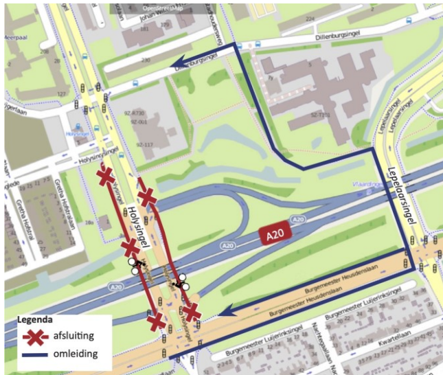
Afbeelding 3 - Fietspaden Holysingel ter hoogte van A20 afgesloten Van woensdag 18 tot en met vrijdag 20 november zijn tussen 21:00 en 05:00 uur (op zaterdag tot 08:00 uur) de fietspaden aan beide zijden dicht.