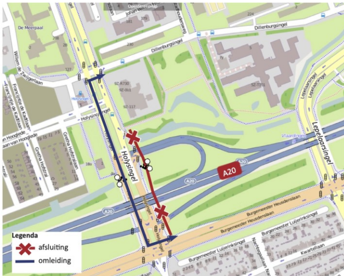
Afbeelding 2 - Fietspad oostzijde Holysingel ter hoogte van A20 afgesloten Van maandag 16 november 21:00 uur tot zaterdag 21 november 08:00 uur