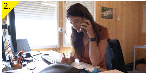
Bellen met de bouwopzichter