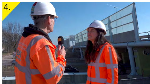
Overleg op de bouwlocatie