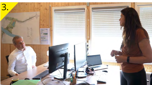
Overleg met de omgevingsmanager