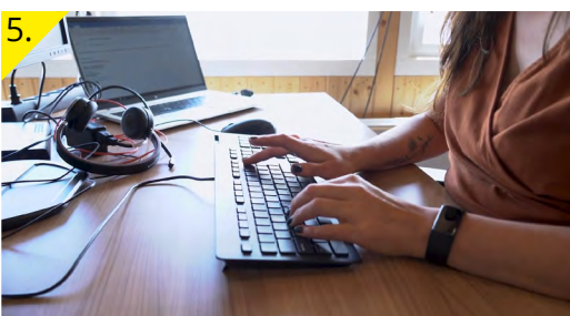
Mailen met een bewoner over de geluidsnorm