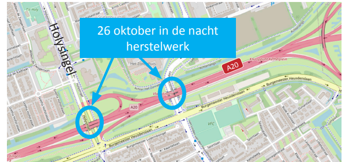
Afbeelding 1 Locaties werkzaamheden 26 oktober in de avond en nacht

Om de werkzaamheden veilig uit te kunnen voeren, zijn afsluitingen op de snelweg nodig. Dit mag alleen als er minder verkeer op de weg is, daarom doen we dit in de avond en de nacht.