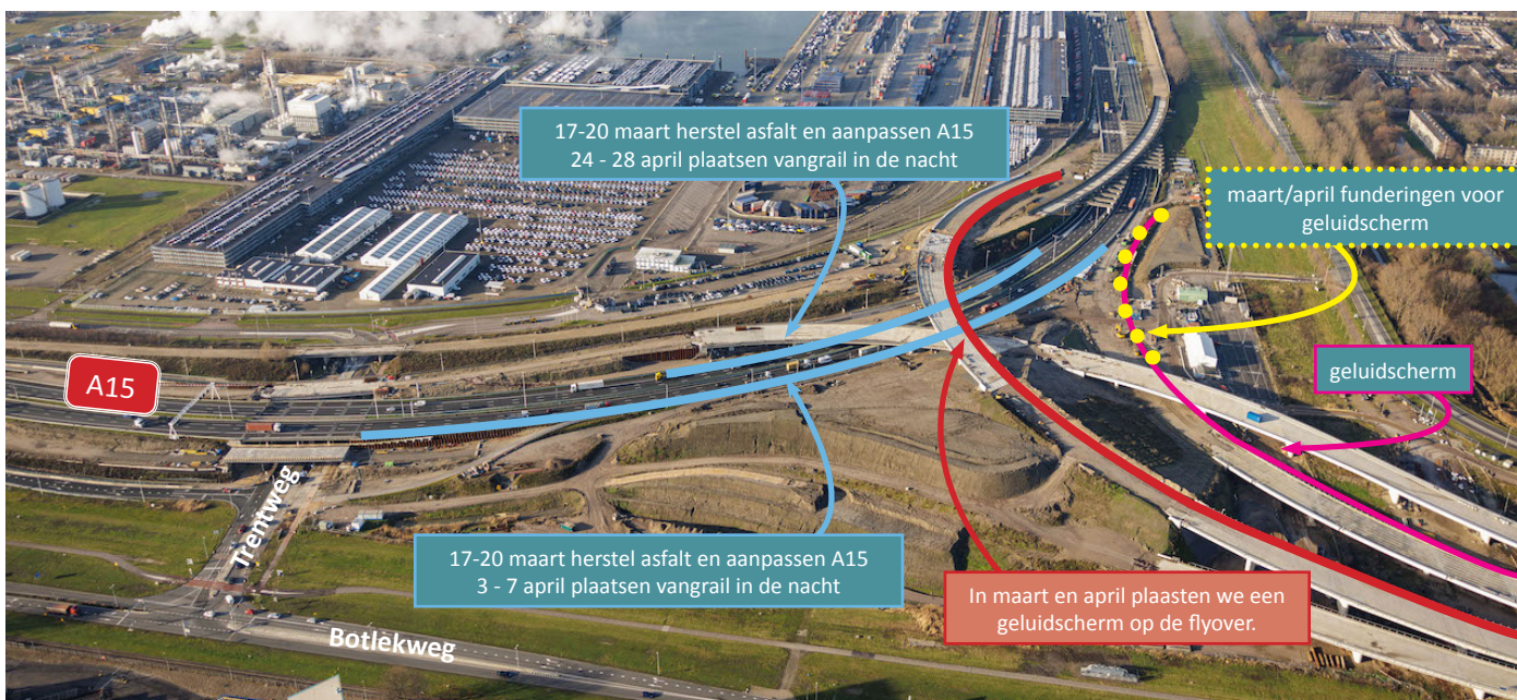
Afbeelding 1 Werkzaamheden knooppunt Rozenburg in maart en april

Het monteren van de leuning en het geluidscherm in de nacht in maart en april zorgt voor weinig geluid in de omgeving. Het plaatsen van de vangrails in de nacht in april en het intrillen van de palen voor het geluidscherm overdag zorgen voor geluid in de omgeving. Dit kan hinderlijks zijn voor omwonenden.