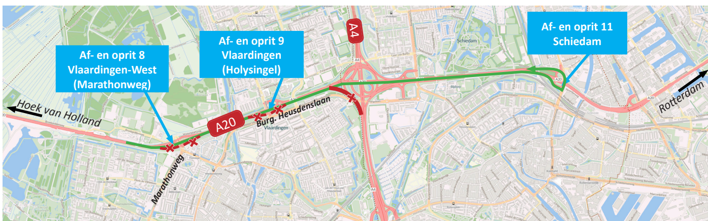
Afbeelding 2 Nachtafsluitingen en omleidingen van vrijdag 2 december 21:00 uur tot zaterdag 3 december 08:00 uur