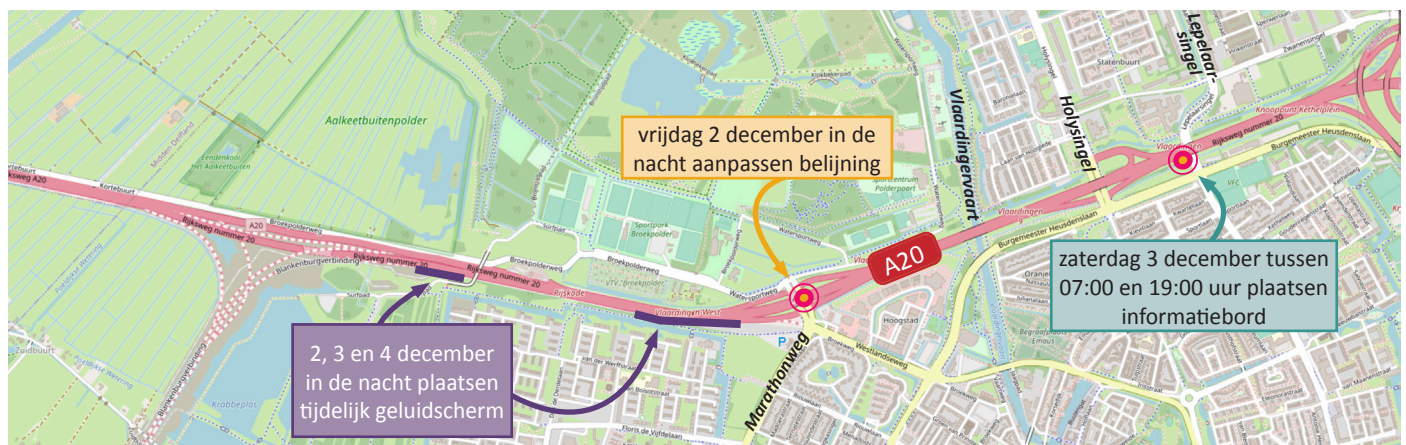
Afbeelding 1 Wegwerkzaamheden A20 2 - 5 december

De verschillende werkzaamheden die we in de nacht uitvoeren, zorgen voor geluid in de omgeving. Het intrillen van de buispaal zorgt voor veel geluid en kan hinderlijk zijn voor omwonenden. Daarom doen we dit op zaterdag overdag.