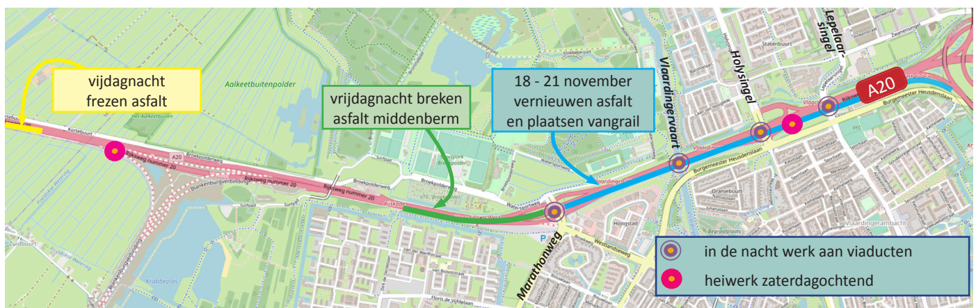
Afbeelding 1 Werkzaamheden A20 van 18 november 22:00 uur tot 21 november 05:00 uur

Als dank voor uw geduld het afgelopen jaar bieden Rijkswaterstaat en BAAK u bij deze brief iets lekkers aan.