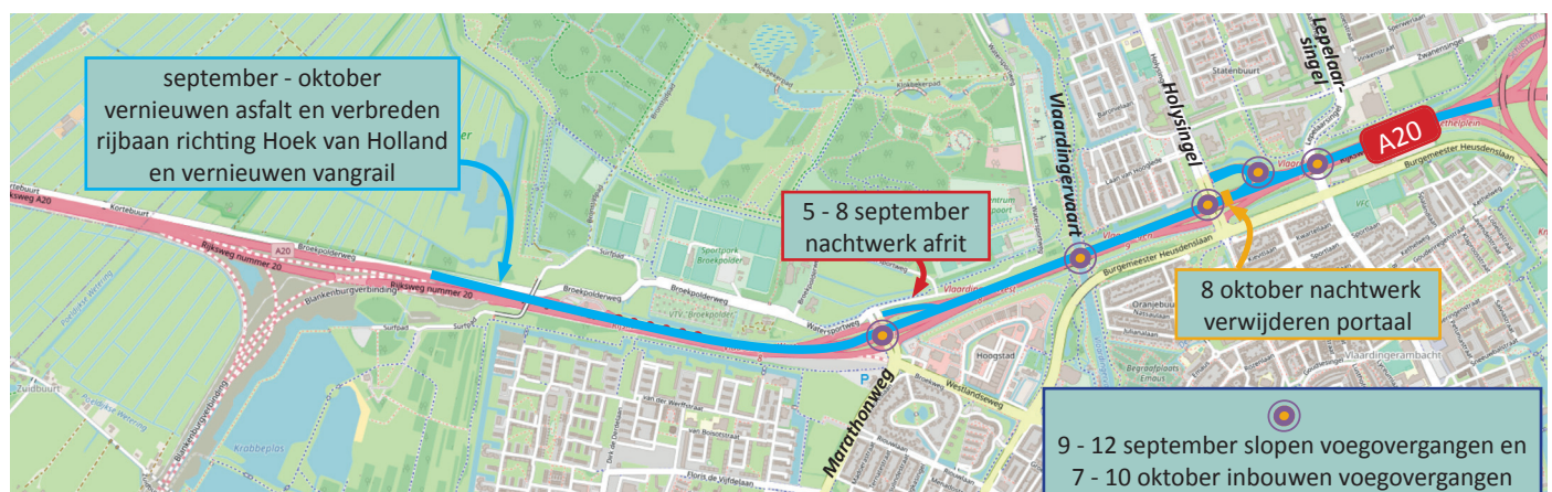
Afbeelding 1 Werklocaties A20 tussen Maassluis en Kethelplein september en oktober 2022

In oktober, november en december voeren we vrijwel dezelfde werkzaamheden uit op de rijbaan richting Rotterdam. Hierover ontvangt u half oktober een bouwbericht.