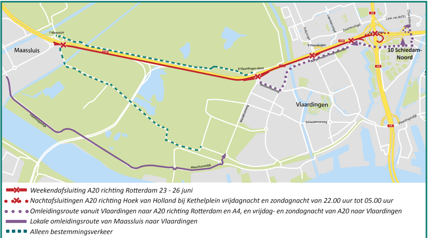
Afbeelding 3 Weekendaafsluiting A20 richting Rotterdam en 23 - 26 juni en lokale omlleidingen

BAAK legt in opdracht van Rijkswaterstaat de Blankenburgverbinding aan. De nieuwe weg verbindt de A15 en de A20 tussen Rozenburg en Vlaardingen en verbetert de bereikbaarheid van de bedrijven in het Rotterdamse havengebied en in Greenport Westland.