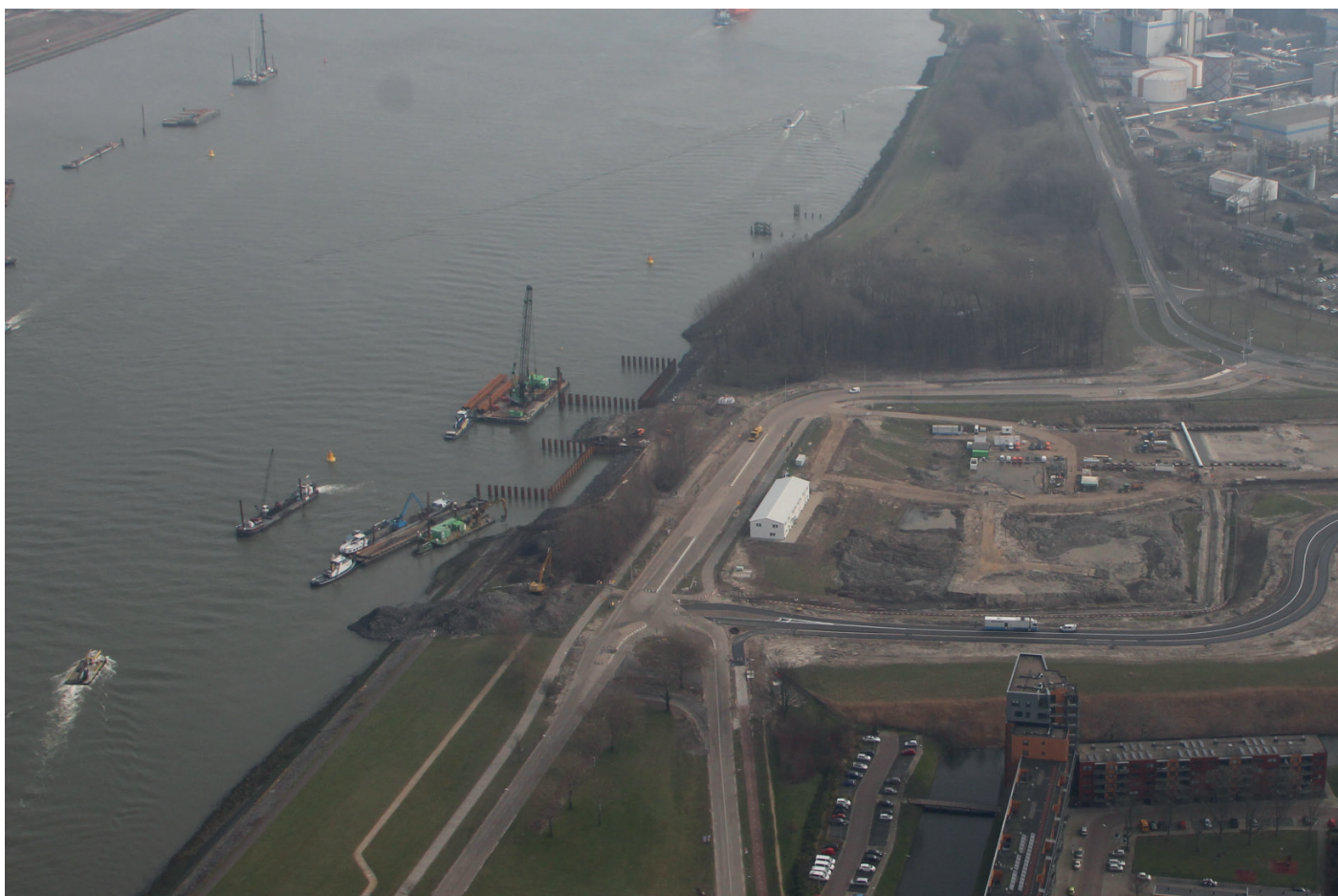
Afbeelding 3 Voortgang bouw kistdam februari 2019

verwachten dat de wanden medio mei klaar zijn. Daarna worden de verschillende delen uitgegraven, voorzien van een drainagesysteem en gevuld met zand.