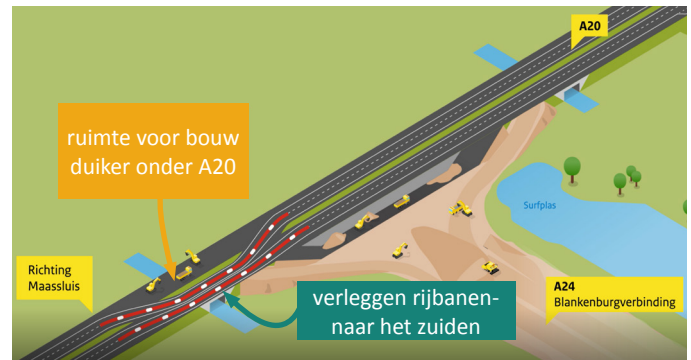
Afbeelding 1 Verleggen rijstroken A20 voor bouw duiker onder de snelweg

Het verleggen van de rijbanen is veel werk voor één weekend. Op maandag 7 en dinsdag 8 februari bereiden we in de nacht de werkzaamheden alvast voor, we zetten onder andere een barrier langs de A20 als afscherming tussen de snelweg en de berm.