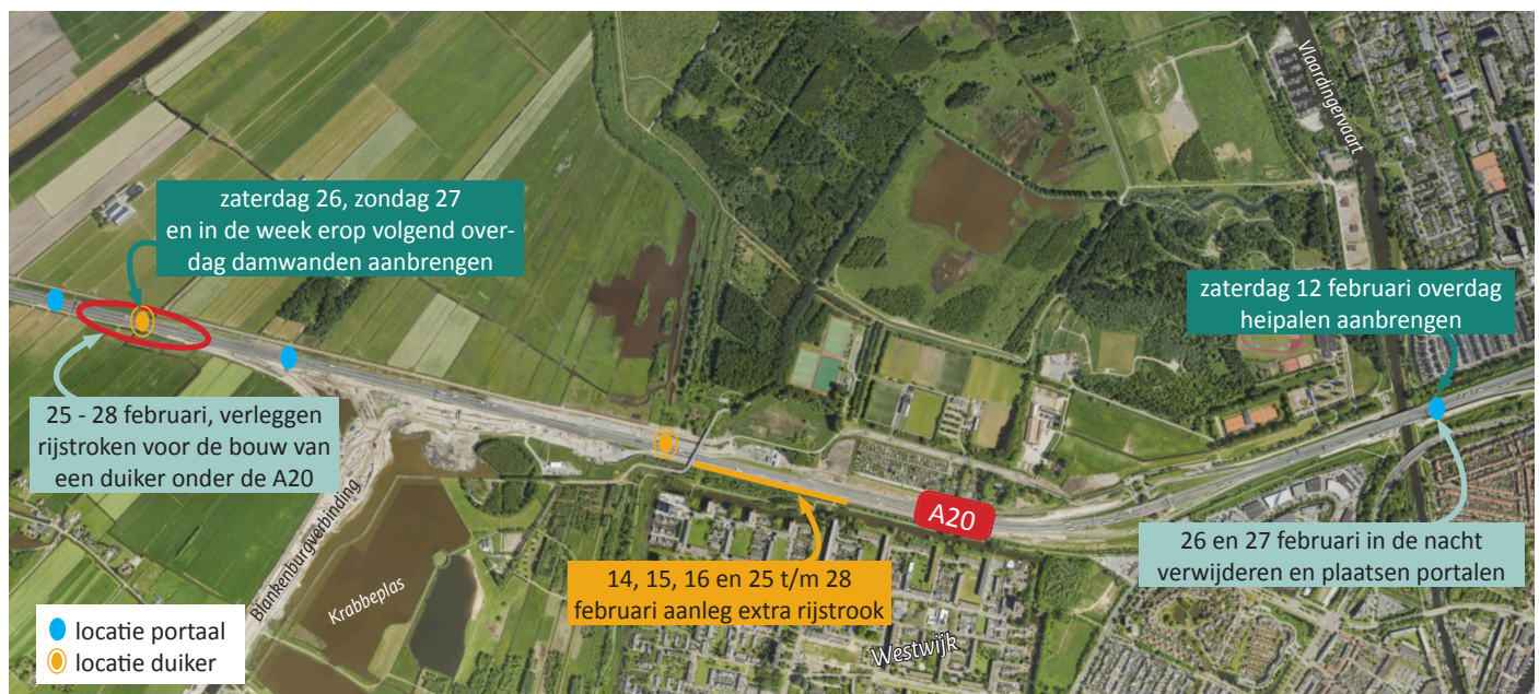
Afbeelding 2 Werklocaties A20

Bij Westwijk verbreden we al een stuk van de A20 (zie afbeelding 2). Hier sluit straks de Blankenburgverbinding aan op de A20 richting Rotterdam. We doen dit op 14, 15 en 16 februari tussen 22:00 en 05:00