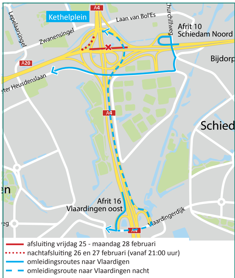
Afbeelding 4 Detail van afsluitingen A20 in Kethelplein Van vrijdag 25 februari 22:00 uur tot maandag 28 februari 05:00 uur