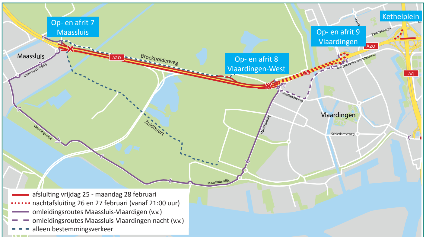
Afbeelding 5 Afsluiting A20 van vrijdag 25 februari 22:00 uur tot maandag 28 februari 05:00 uur en lokale omleidingsroutes

BAAK legt in opdracht van Rijkswaterstaat de Blankenburgverbinding aan. De nieuwe weg verbindt de A15 en de A20 tussen Rozenburg en Vlaardingen en verbetert de bereikbaarheid van de bedrijven in het Rotterdamse havengebied en in Greenport Westland.