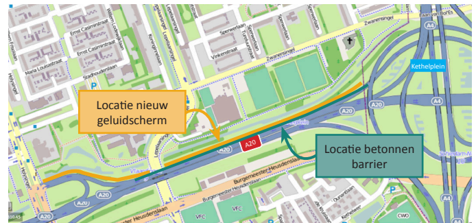
Afbeelding 1 Locatie geluidscherm en barrier