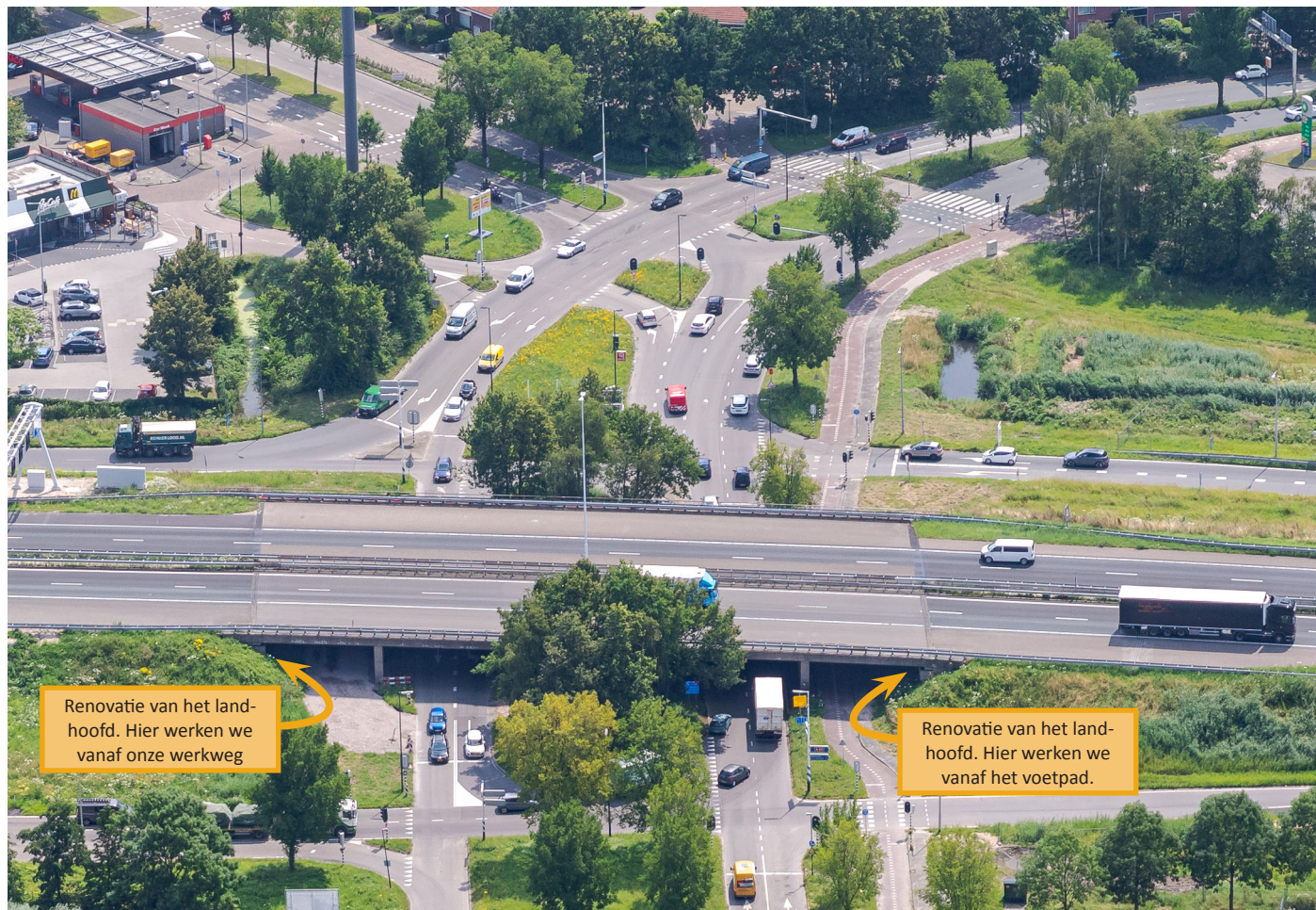
Afbeelding 1 Het viaduct over de Marathonweg wordt gerenoveerd

De werkzaamheden voor de renovatie van het viaduct en de voorbereidingen voor het verleggen van de afrit voeren we uit van maandag tot en met vrijdag tussen 07:00 uur en 19:00 uur. Het weghakken en wegsputten van het beton voor de renovatie zorgt voor geluid in de omgeving. Dit kan hinderlijk zijn voor u als omwonende. De overige werkzaamheden geven weinig hinder.