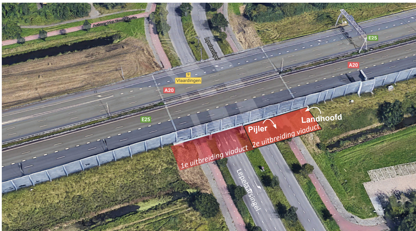
Afbeelding 3 Locatie uitbreiding viaduct Lepelaarsingel

BAAK legt in opdracht van Rijkswaterstaat de Blankenburgverbinding aan. De nieuwe weg verbindt de A15 en de A20 tussen Rozenburg en Vlaardingen en verbetert de bereikbaarheid van de bedrijven in het Rotterdamse havengebied en in Greenport Westland.