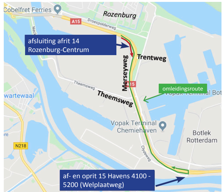
Afbeelding 6 Afsluiting afrit 14 op 5 oktober 21:00 - 05:00 uur

BAAK legt in opdracht van Rijkswaterstaat de Blankenburgverbinding aan. De nieuwe weg verbindt de A15 en de A20 tussen Rozenburg en Vlaardingen en verbetert de bereikbaarheid van de bedrijven in het Rotterdamse havengebied en in Greenport Westland.