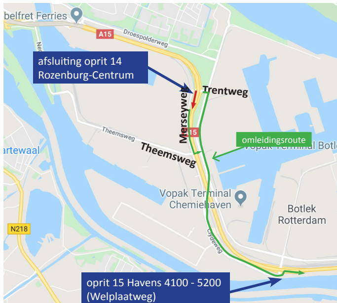
Afbeelding 5 Afsluiting oprit 14 op 5 oktober 21:00 - 05:00 uur

Op maandag 5 oktober werken we tussen 21:00 en 05:00 uur bij af- en oprit 14 Rozenburg-Centrum van de A15 richting Rotterdam. We brengen belijning aan en vervangen verlichting. In deze nacht zijn de af- en de oprit afgesloten. Verkeer wordt omgeleid via af- en oprit 15 Havens 4100 - 5200 (Welplaatweg). (Zie afbeeldingen 5 en 6)