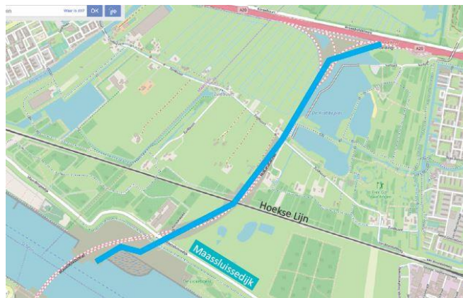
Afbeelding 2: de logistieke route die BAAK op 1 september in gebruik neemt

Op 1 september verwacht BAAK haar logistieke route klaar te hebben. Vanaf die datum zullen alle transporten die nodig zijn voor de bouw van de Blankenburgverbinding via deze route lopen en dus niet meer door Maassluis.