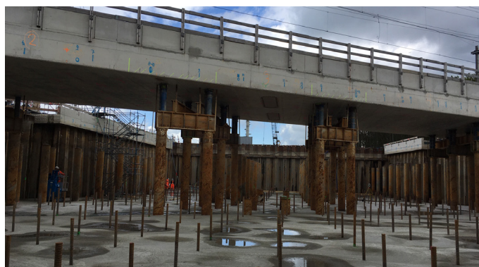
Afbeelding 3 Droge bouwkuip bij Hoekse Lijn

Op afbeelding 3 kunt u zien dat het spoordek op een stalen constructie steunt. Dit is een tijdelijke constructie. We vervangen deze door betonnen pilaren die we tussen de twee rijbanen bouwen.