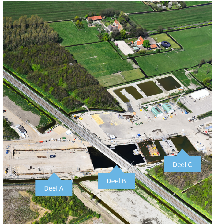
Afbeelding 2 Werkzaamheden bij de Hoekse Lijn

In het derde deel van de onderdoorgang (deel C op afbeelding 2) werken we tot medio mei en van eind mei tot medio juni (met uitzondering van feestdagen) in twee ploegen. De werkzaamheden gaan dan door tot 03:00 uur. We testen de ankerpalen en brengen onder water wapening voor de vloer aan. Medio juni storten we, net als in het deel B, in 36 uur onder water een betonvloer. In juni informeren we u over deze werkzaamheden en de mogelijke hinder.