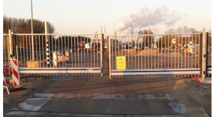
Afbeelding 2 Kruising Zuidbuurt

Tussen 6 en 10 april passen we de kruising van de nieuwe werkweg met de Zuidbuurt aan. We verplaatsen de hekken en de verkeerslichten en testen of alles goed werkt. Ook de verkeersborden die langs