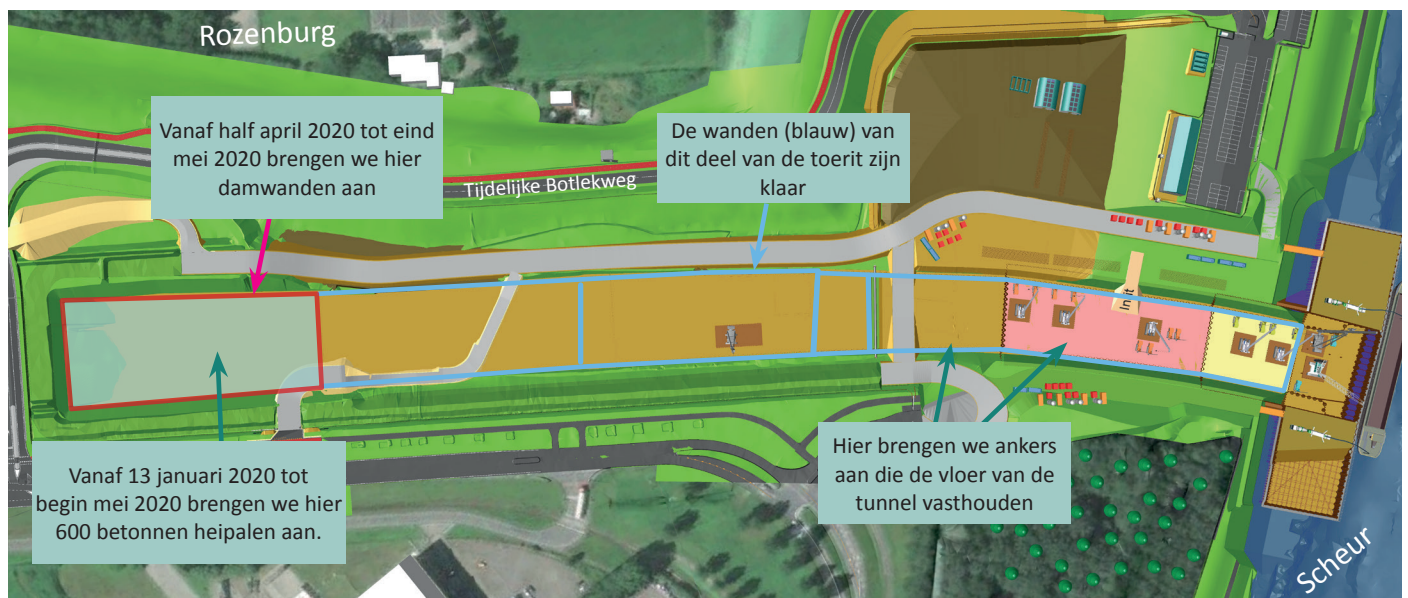
Afbeelding 2 Overzicht funderingswerkzaamheden Maasdeltatunnel

Als in een compartiment de ankers zijn aangebracht, starten we met het uitgraven van de toerit. Het eerste deel graven we droog. Daarna zetten we het compartiment vol water om tegendruk aan het grondwater te bieden. We graven onder water verder tot er voldoende diepte is. In de zomer van 2020 brengen we de funderingen aan voor het Blankenburgviaduct. Hiermee gaat de Droespolderweg over de A24 (zie afbeelding 3). In 2021 bouwen we het viaduct af.