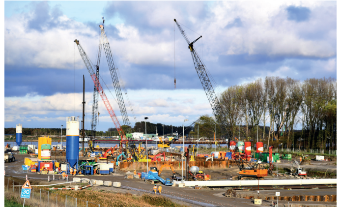
Afbeelding 1 Ankers aanbrengen voor de toerit van de Maasdeltatunnel

De heipalen slaan we met een heimachine met een blok in de grond. Dit zorgt voor geluid en kan hinderlijk zijn voor omwonenden. Ook