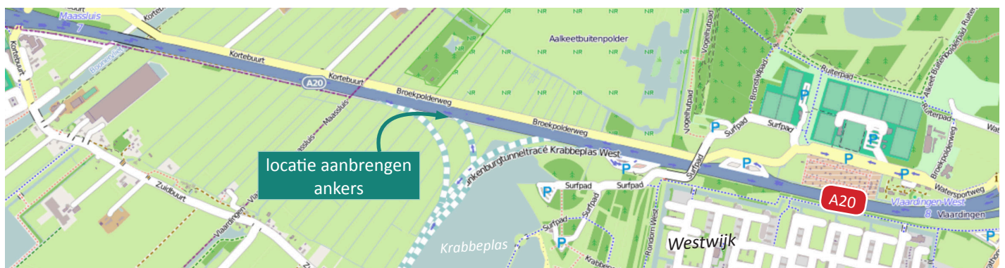
Afbeelding 3 Locatie werkzaamheden 27 - 28 februari

BAAK legt in opdracht van Rijkswaterstaat de Blankenburgverbinding aan. De nieuwe weg verbindt de A15 en de A20 tussen Rozenburg en Vlaardingen en verbetert de bereikbaarheid van de bedrijven in het Rotterdamse havengebied en in Greenport Westland.