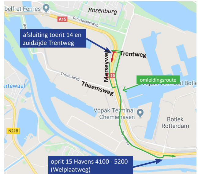
Afbeelding 1 Afsluiting toerit 14 naar A15 Rotterdam 2 - 7 september

In deze periode is de afrit afgesloten voor het verkeer. Ook de Trentweg is ter hoogte van de afrit in beide richtingen dicht. Via de Merseyweg zijn de af- en toerit van de A15 richting Rotterdam bereikbaar. Op afbeelding 3 ziet u de afsluiting en de omleidingsroute.