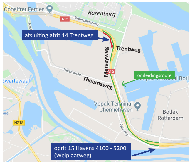
Afbeelding 2 Nachtsluiting afrit 14 van A15 vanuit Europoort 2-7 september