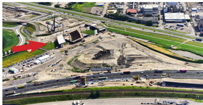
Afbeelding 4 Luchtfoto knooppunt Rozenburg juni 2020

In de tweede helft van september zetten we een damwand langs de toerit die vanaf de Trentweg naar de A15 richting Rotterdam gaat (zie