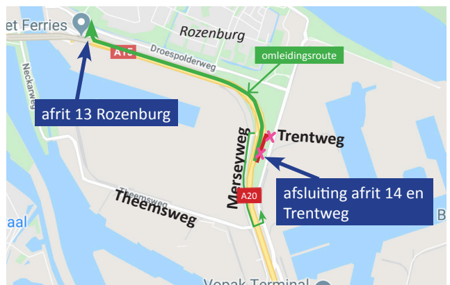
Afbeelding 3 Afsluiting afrit 14 van A15 vanuit Rotterdam 18-21 september