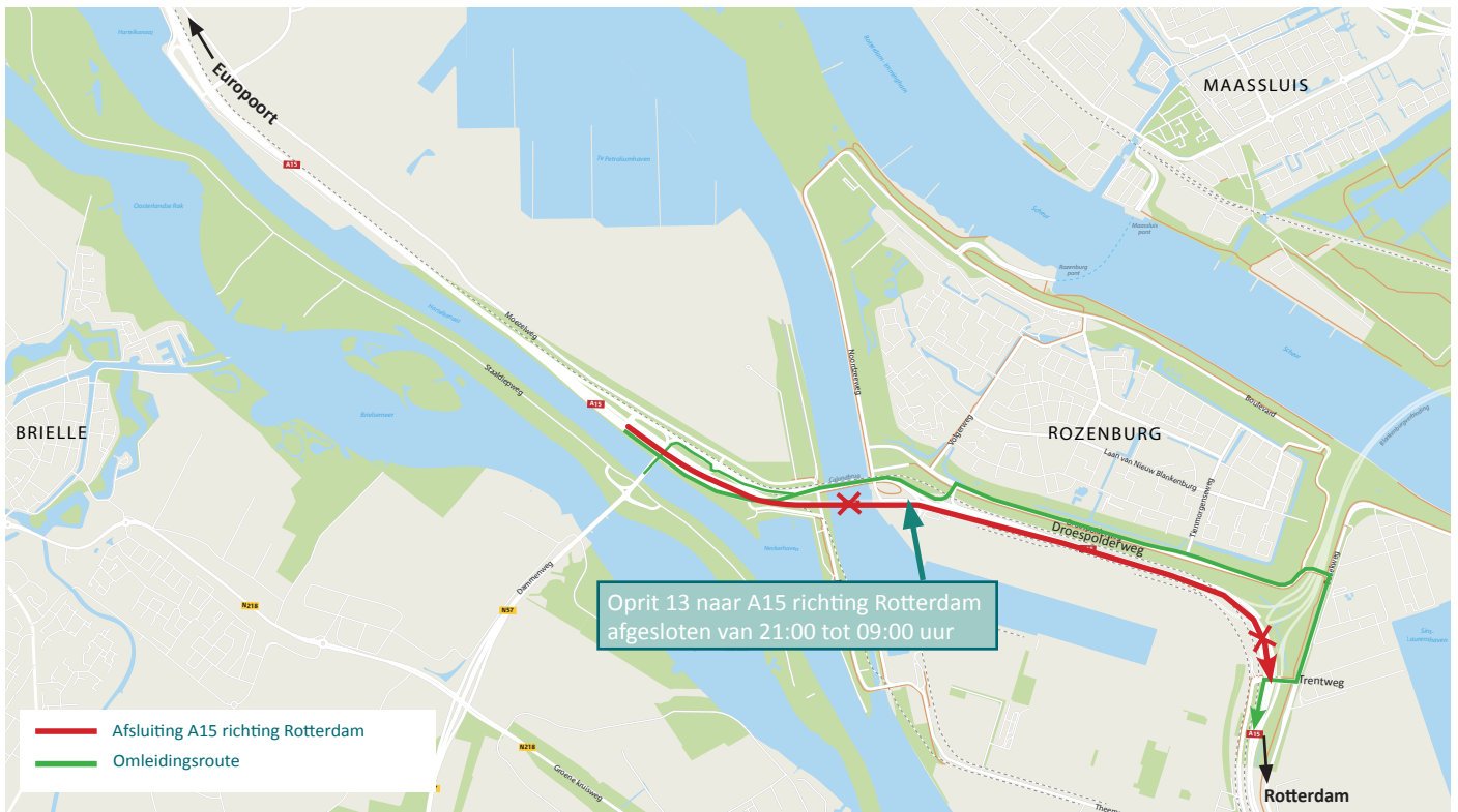
Afbeelding 4 Afsluiting A15 richting Rotterdam tussen Thomassentunnel en Trentweg van vrijdag 8 november 21:00 uur tot zaterdag 9 november 09:00 uur