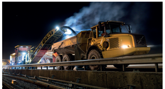
Afbeelding 3 Freeswerk

Verkeer wordt omgeleid via de Droespolderweg en oprit 14 bij de Trentweg.