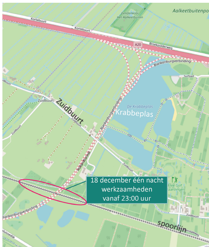
Afbeelding 1 Werklocatie 18 december

Van dinsdag 18 december 23:00 uur tot woensdag 19 december 07:00 uur werkt BAAK ter hoogte van de Hollandtunnel één nacht aan het spoor (zie locatie op afbeelding 1). In november brachten we hier palen aan voor het deel dat onder de spoorlijn doorgaat. Nu dit werk klaar is, brengen we met een grote machine ballast onder de dwarsliggers van het spoor aan, waardoor de spoorlijn weer in een strakke lijn komt te liggen. Omdat er overdag en in de avond testen worden uitgevoerd voor de Hoekse Lijn, kunnen wij dit werk alleen in de nacht doen. Mogelijk ondervindt u hinder van de verlichting van de bouwplaats en het geluid van machines en het storten van de ballaststenen.