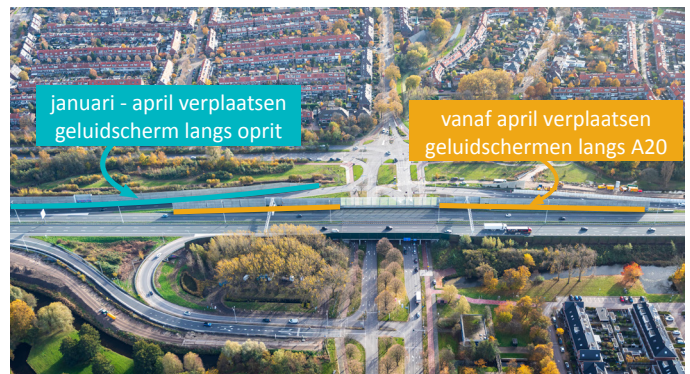
Afbeelding 1 Locatie geluidschermen bij oprit 9 Vlaardingen

Van maandag 10 tot en met vrijdag 14 januari werken we tussen 21:00 uur en 05:00 uur op de oprit. We leggen een werkinrit aan en plaatsen in de nacht van 13 januari het tijdelijke geluidscherm op de oprit. Het scherm vormt ook de afscheiding tussen de rijbaan en het werkterrein.