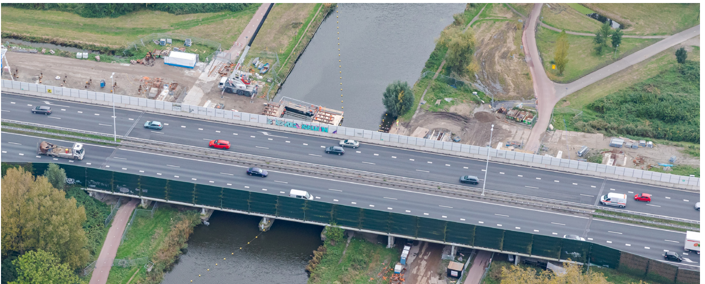
Afbeelding 2 Luchtfoto van werkzaamheden viaduct over de Vlaardingervaart oktober 2021

Mocht u naar aanleiding van dit bericht vragen hebben, dan kunt u een e-mail sturen naar omgeving@baakbbv.nl .