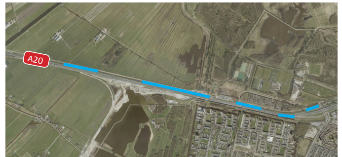
Afbeelding 2 Locaties aanbrengen zand

Voor de bouw van knooppunt Vlaardingen en de verbreding van de A20, brengen we in januari en februari overdag zand aan langs de A20 (zie afbeelding 2). Dit zand blijft ongeveer een jaar liggen zodat de bodem kan inklinken en er een stevige ondergrond ontstaat. De werkzaamheden geven weinig hinder.