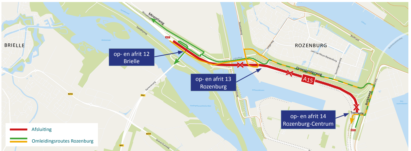
Afbeelding 3 Afsluiting A15 in beide richtingen en omléidingsroute bij Rozenburg