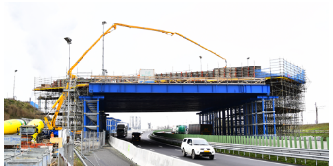
Afbeelding 1 Bouwen boven de A15

Bekijk het laatste nieuws, foto's en filmpjes op www.blankenburgverbinding.nl . Hier vindt u ook de actuele planning van het project en een overzicht van activiteiten die Rijkswaterstaat en BAAK rond de bouwplaats organiseren.