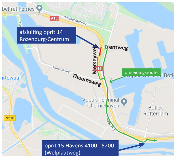
Afbeelding 5 Afsluiting op- en afrit 14 op 5 oktober 21:00 - 05:00 uur

Op maandag 5 oktober werken we tussen 21:00 en 05:00 uur bij af- en oprit 14 Rozenburg-Centrum van de A15 richting Rotterdam. We brengen belijning aan en vervangen verlichting. In deze nacht zijn de af- en de oprit afgesloten. Verkeer wordt omgeleid via af- en oprit 15 Havens 4100 - 5200 (Welplaatweg). (Zie afbeeldingen 5 en 6)