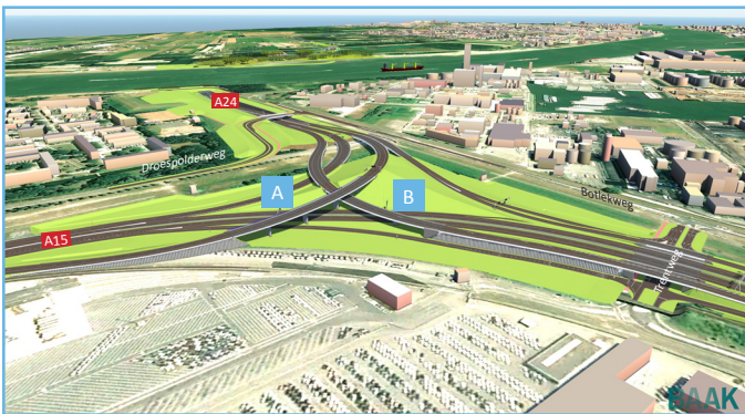
Afbeelding 1 Ontwerp knooppunt Rozenburg

Van vrijdag 9 oktober 22:00 uur tot maandag 12 oktober 05:00 uur is de A15 bij Rozenburg in beide richtingen afgesloten. In dit weekend bouwt BAAK een stalen tafelconstructie over de A15. Hierop bouwen we de fly-overs van het nieuwe knooppunt Rozenburg (afbeelding 1). Met dit bouwbericht informeren we u over de werkzaamheden, de afsluiting en de omleidingen.