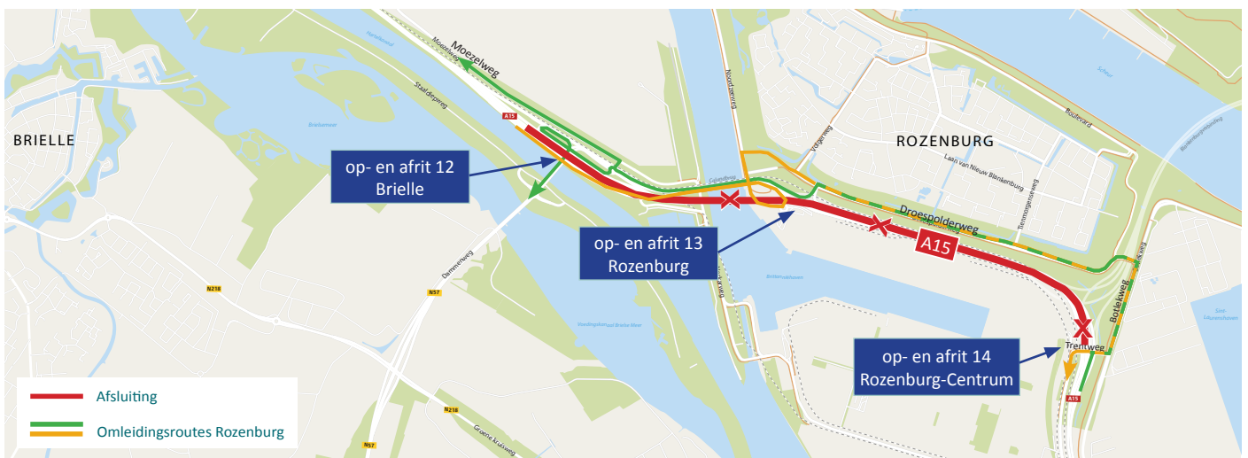
Afbeelding 3 Afsluiting A15 in beide richtingen van vrijdag 9 oktober 22:00 uur tot maandag 12 oktober 05:00 uur en omleiding bij Rozenburg