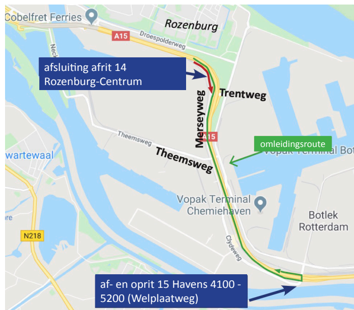
Afbeelding 6 Afsluiting af- en op-rit 14 op 5 oktober 21:00 - 05:00 uur

BAAK legt in opdracht van Rijkswaterstaat de Blankenburgverbinding aan. De nieuwe weg verbindt de A15 en de A20 tussen Rozenburg en Vlaardingen en verbetert de bereikbaarheid van de bedrijven in het Rotterdamse havengebied en in Greenport Westland.