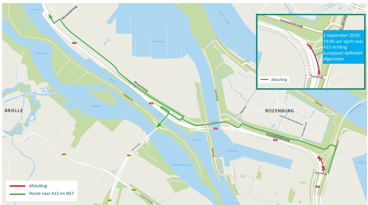
Afbeelding 1 Afsluiting oprit A15 vanaf 2 september 19:00 uur

Door de afsluiting van de oprit naar de A15 richting Europoort zal er meer verkeer over de Droespolderweg rijden. Om het verkeer in Rozenburg goed te regelen, worden verkeerslichten op de kruisingen met de Tienmorgenseweg, Volgerweg en de toerit naar de Calandbrug geplaatst.