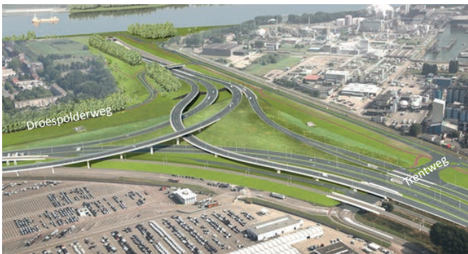
Afbeelding 1 Knooppunt Rozenburg in de eindsituatie

Vanaf 27 augustus tot eind november werkt BAAK regelmatig in de avond en nacht op de A15. In deze periode verschuiven we bij Rozenburg de rijbanen van de snelweg naar de middenberm. Zo kan het verkeer op de A15 over drie rijstroken blijven rijden als we naast de snelweg de pijlers van de flyovers voor knooppunt Rozenburg bouwen (afbeelding 1). Tussen 2 en 16 september passen we de Trentweg aan. Met dit bouwbericht informeren we u over de werkzaamheden, de mogelijk geluidshinder en de benodigde verkeersmaatregelen.