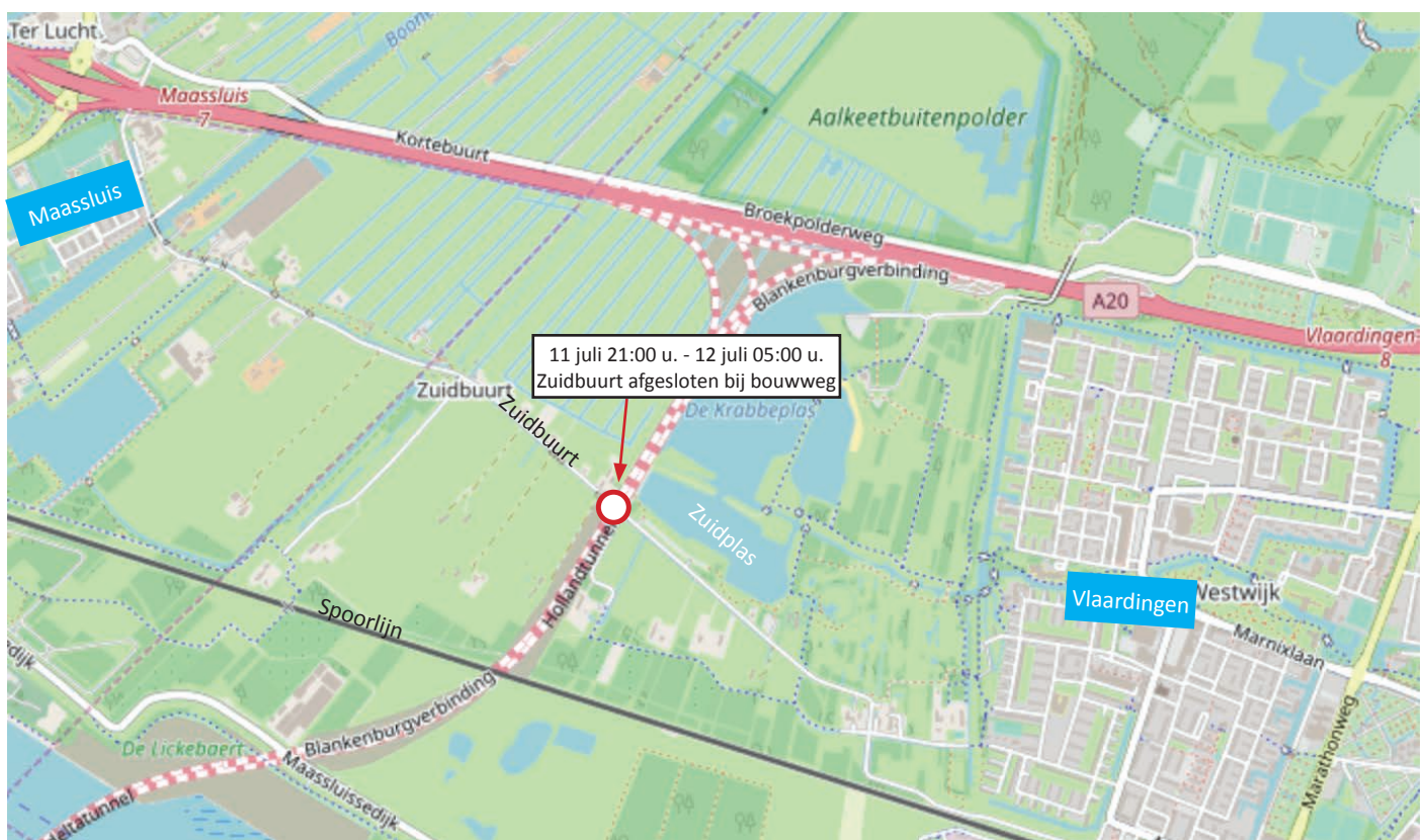
Afbeelding 1 Werklocatie Zuidbuurt

Het verkeer op de Zuidbuurt heeft voorrang en heeft daarom vooral groen licht. Alleen als werkverkeer de Zuidbuurt wil kruisen, krijgt het verkeer op de Zuidbuurt rood licht, gaan de schuifhekken op de werkweg open en kan werkverkeer oversteken. De schuifhekken gaan daarna weer dicht. De verkeerslichten blijven staan tot begin 2023.