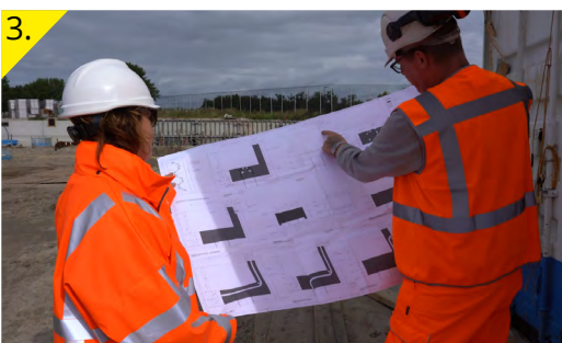
Overleg over wat er moet gebeuren