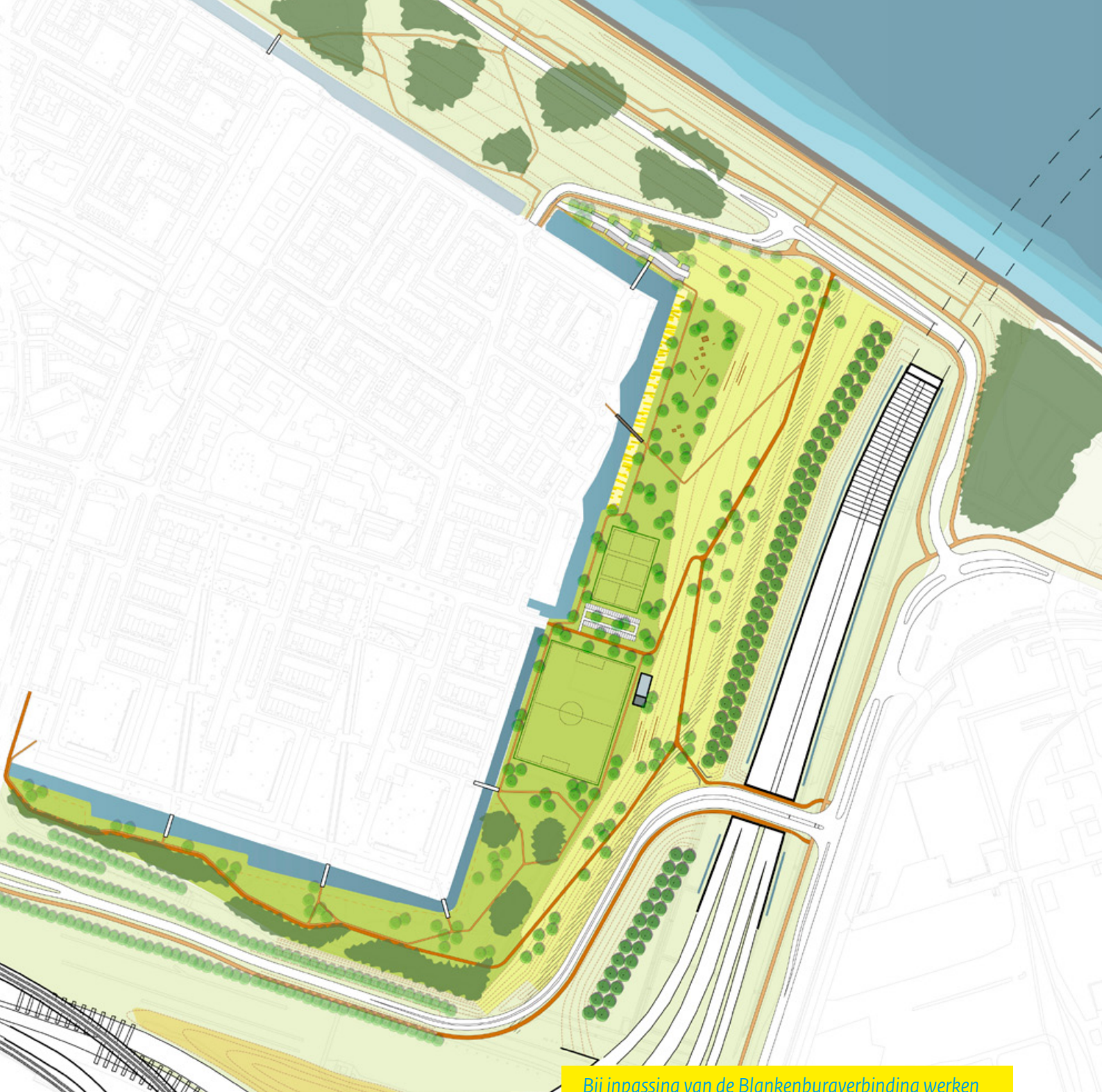
Impressie Ostrand Rozenburg

Bij inpassing van de Blankenburgverbinding werken Rijkswaterstaat, Metropoolregio Rotterdam Den Haag, gemeente Rotterdam, gemeente Vlaardingen, Hoogheemraadschappen Hollandse Delta en Delfland en Recreatieschap Midden-Delfland samen.