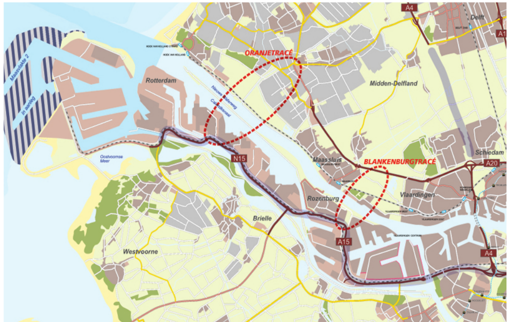
Figuur 1.1. Zoekgebied Oranjeverbinding en Blankenburgverbinding

de Oranjeverbinding. Besloten is deze nieuwe oeververbinding nader te onderzoeken, zodat een onderbouwde en overwogen keuze gemaakt kan worden voor een (tunnel)variant binnen de Blankenburg- of de Oranjeverbinding en ook afspraken kunnen worden gemaakt over eventueel aanvullende maatregelen in het netwerk.