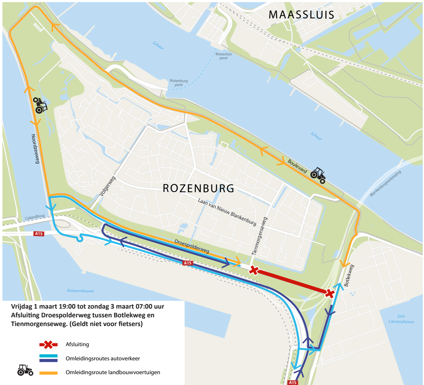
Afbeelding 1 Afsluiting en omleidingsroutes 1 maart 19:00 - 3 maart 07:00 uur

Met dit bouwbericht informeren we u over de werkzaamheden, de afsluiting, de omleidingsroutes en de mogelijke hinder.