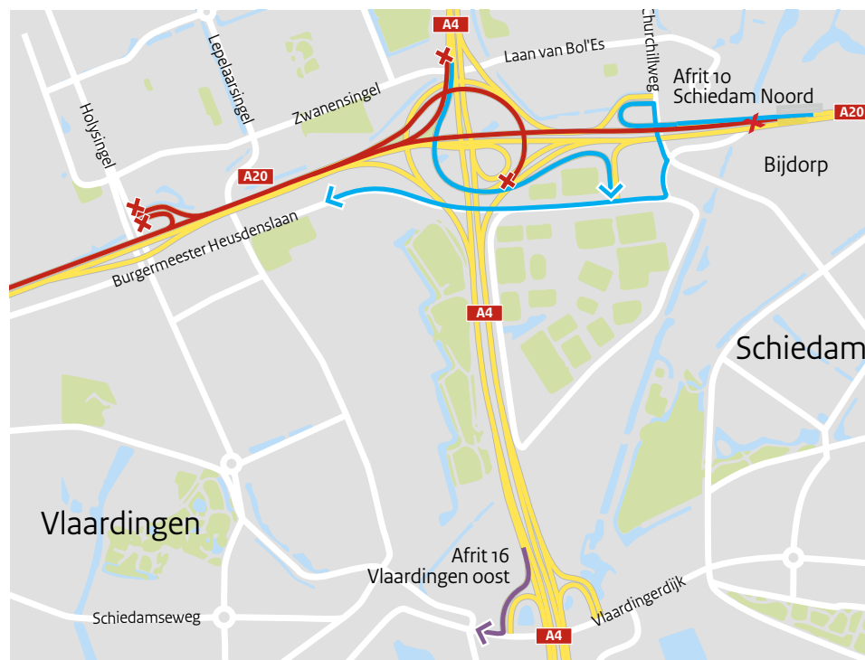
Afbeelding 6 Omlleidingsroute voor verkeer met bestemming Vlaardingen