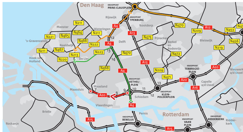
✘ = afsluiting ➔ = omleiding A4 - N223 - A20 ➔ = omleiding A4 - N211 - N222 Afbeelding 4 Afsluiting A20 richting Hoek van Holland en omlleidingsroutes van 2 tot 5 november