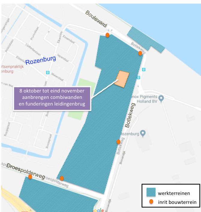
Afbeelding 1 Locatie combiwanden kabels en leidingenbrug

Verschillende kabels en leidingen kruisen het tracé van de Maasdelatunnel en moeten worden verplaatst. Op 8 oktober starten we met de bouw van een brug voor deze kabels en leidingen. De brug steunt op twee zogenaamde combiwanden met een lengte van 75 meter. De combiwanden bestaan uit stalen buizen met een doorsnede van 1,60 meter en een lengte van zo'n 28 meter met daartussen stalen damwandplanken, ook met een lengte van ongeveer 28 meter. De buizen en damwandplanken worden met diepladers via de Botlekweg naar de bouwplaats vervoerd. Met een grote kraan met trilhamer worden