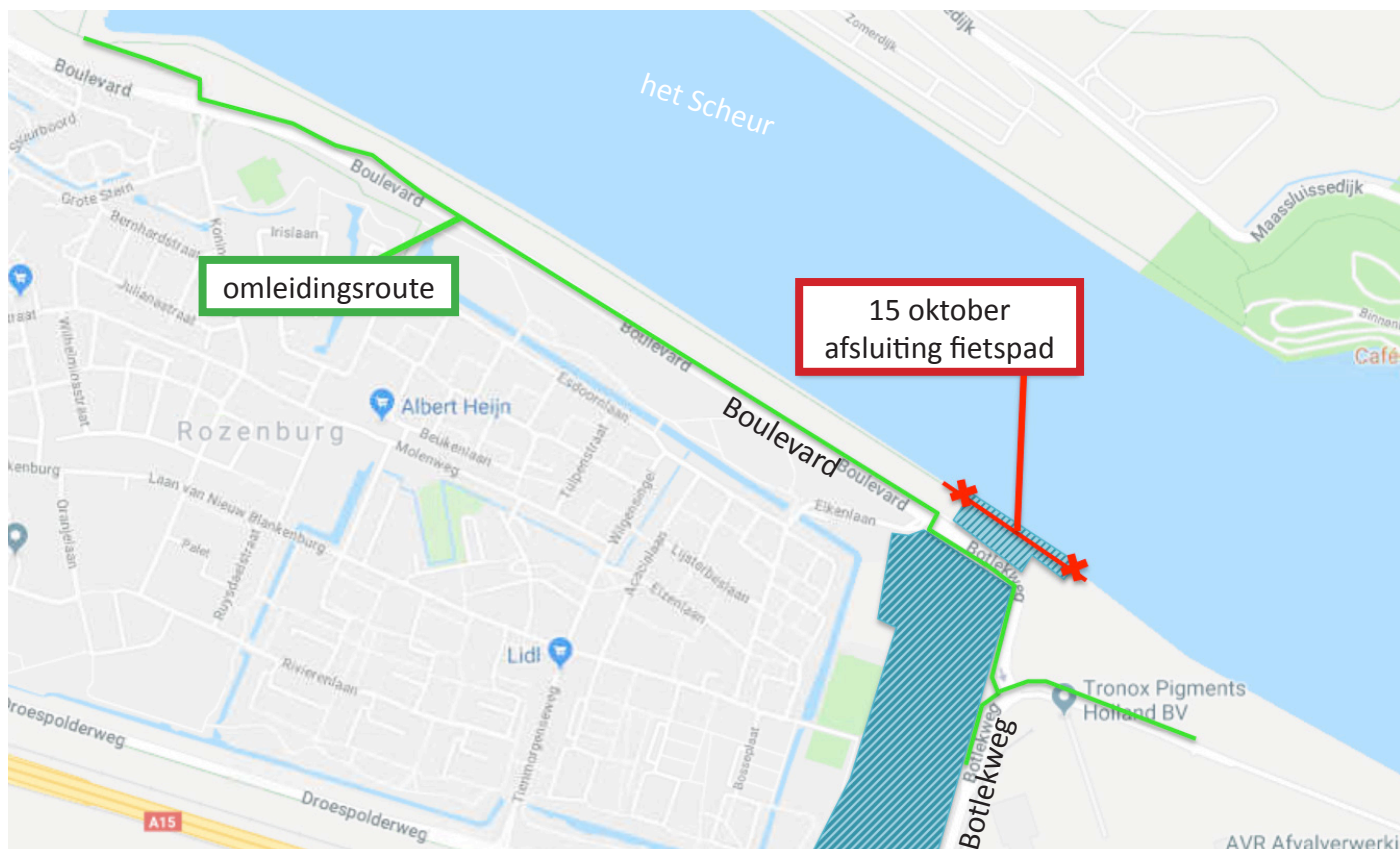
Afbeelding 3 Afsluiting fietspad langs het Scheur en omleidingsroute

www.blankenburgverbinding.nl/werkzaamheden . Hier staat de actuele planning. Wilt u automatisch op de hoogte blijven van wijzigingen in de planning die op de website staat? Stuur dan een e-mail naar omgeving@blankenburgverbinding.nl , dan ontvangt u ze per e-mail.