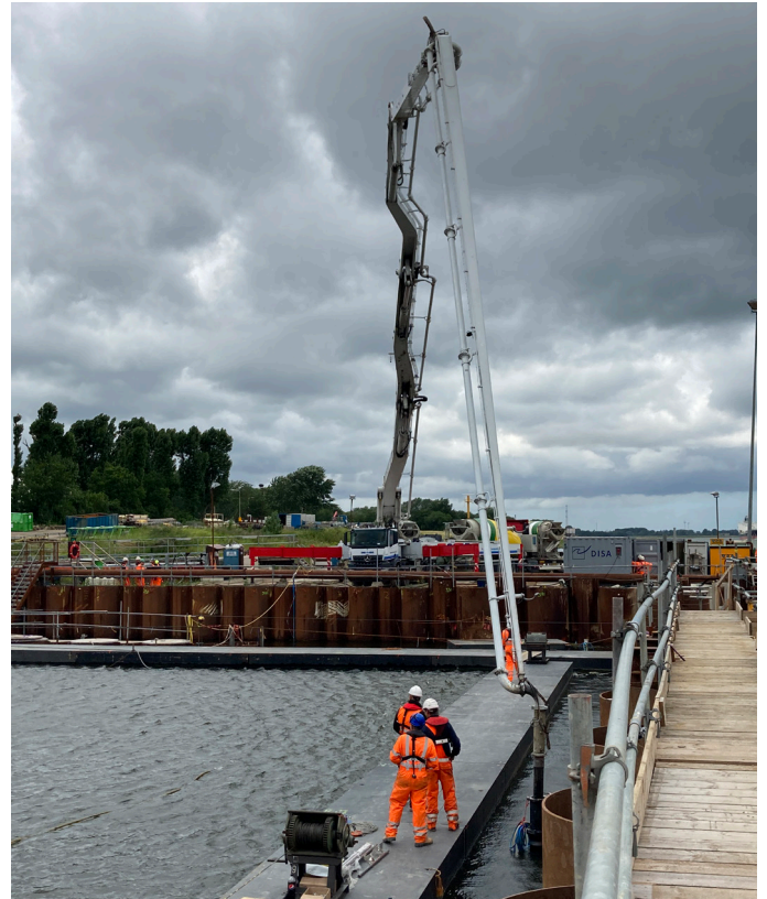
Afbeelding 1 Betonstort eerste vloer van de tunnel

De betonstort start op maandag 13 september om 07:00 uur en duurt tot uiterlijk vrijdag 17 september tot het eind van de dag. De werkzaamheden zorgen voor geluid in de omgeving, onder andere door vrachtwagens die heen en weer naar de bouwplaats rijden, een betonpomp die continu draait en andere machines en achteruitrijpijpers van werkverkeer. De bouwplaats wordt goed verlicht. Dit kan zichtbaar zijn voor omwonenden.