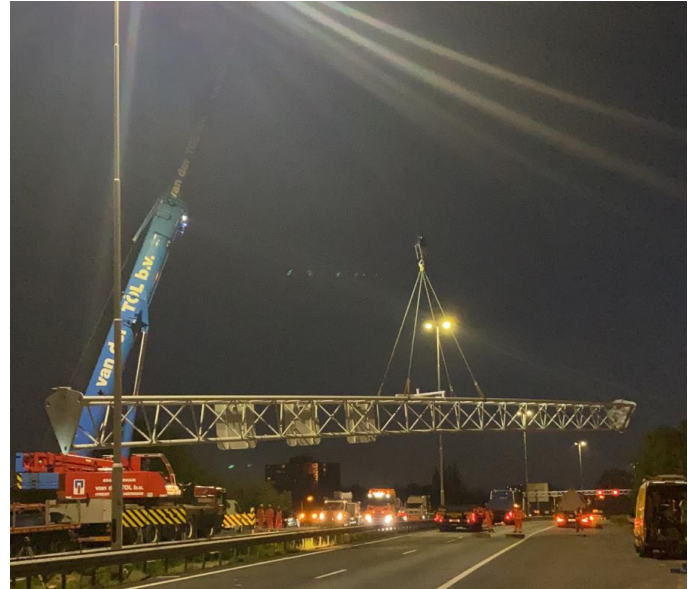
Afbeelding 2 inhijsen portaal boven A20

De Kortebuurt/Broekpolderweg en de Zuidbuurt zijn deze nacht afgesloten voor doorgaand verkeer. Verkeersregelaars laten bestemmingsverkeer passeren.