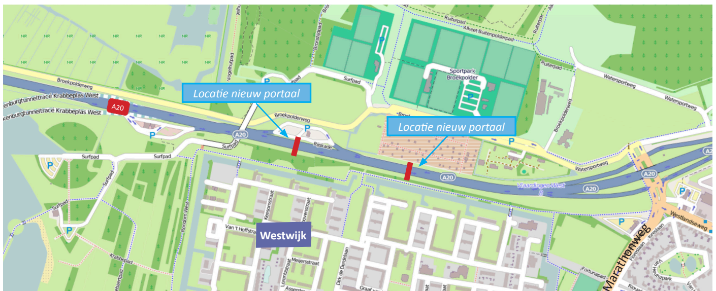
Afbeelding 1 locatie plaatsen nieuwe portalen