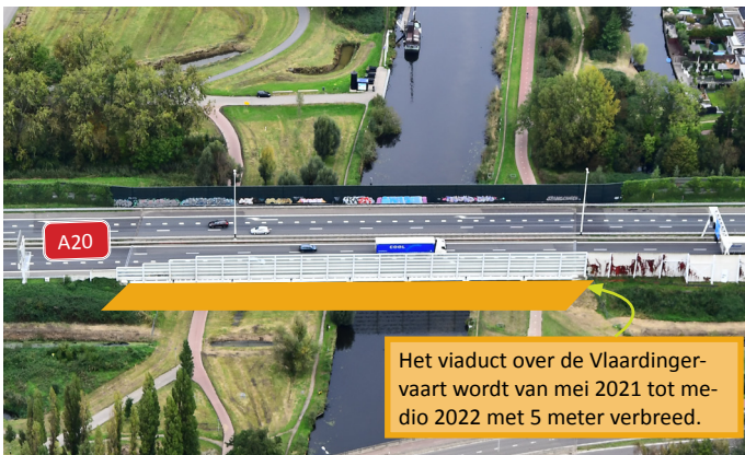
Afbeelding 1 Locatie uitbreiding viaduct Vlaardingervaart

Als de pijlers klaar zijn, hijsen we er betonnen liggers op. De liggers vormen de basis van het dek van het viaduct. Op de liggers brengen we een laag beton aan om het dek vlak af te werken. Medio 2022 plaatsen we het geluidsscherm weer terug op het viaduct en is de uitbreiding klaar. Aan de noordkant vervangen we de groene panelen van het bestaande geluidsscherm.