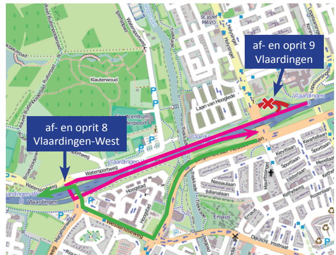
Afbeelding 2 Afsluiting op- en afrit 9 Vlaardingen en omlleidingsroutes

Verkeer voor afrit 9 Vlaardingen naar de Holysingel kan keren bij afrit 8 Vlaardingen-West. Verkeer voor de A20 richting Hoek van Holland, wordt omgeleid via de Burgemeester Heusdenslaan en de Westlandseweg naar oprit 8 bij de Marathonweg (zie afbeelding 2).