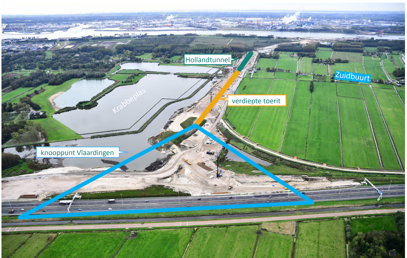
Afbeelding 1 Schematische weergave bouw knooppunt Vlaardingen, verdiepte toerit en Hollandtunnel

In juni zijn we bij de Zuidbuurt begonnen met de bouw van de Hollandtunnel en de verdiepte toerit langs de Krabbeplas. In de eerste fase brengen we damwanden aan voor de wanden van de tunnel en de toerit. We brengen ook heipalen en ankers aan voor de vloer.