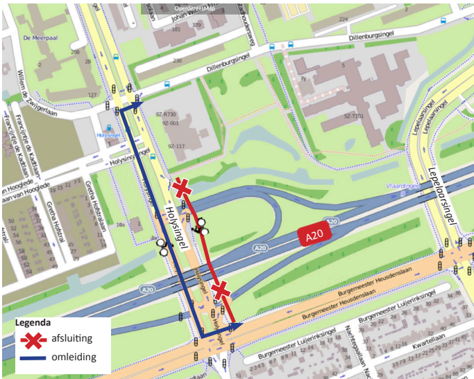
Afbeelding 2 - Fietspad oostzijde Holysingel ter hoogte van A20 afgesloten Van maandag 16 november 21:00 uur tot zaterdag 21 november 08:00 uur