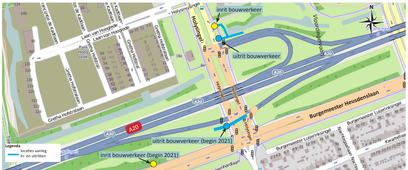
Afbeelding 1 Locaties in- en uitritten werkverkeer bij Holysingel

De werkzaamheden voor de in- en uitrit voeren we uit van maandag tot en met vrijdag tussen 21:00 en 05:00 uur. Op zaterdagochtend werken we door tot 08:00 uur. We maken gebruik van grote en zware machines. Deze zorgen voor geluid in de omgeving. Dit kan hinderlijk zijn voor omwonenden. Mogelijk heeft u ook last van verlichting van de bouwplaats en het geluid van werkverkeer.