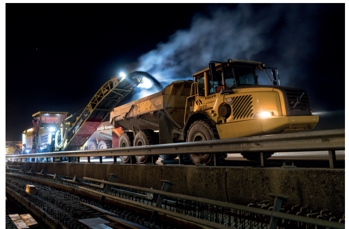
Afbeelding 3 Freeswerk

Verkeer wordt omgeleid via de Droespolderweg en oprit 14 bij de Trentweg.