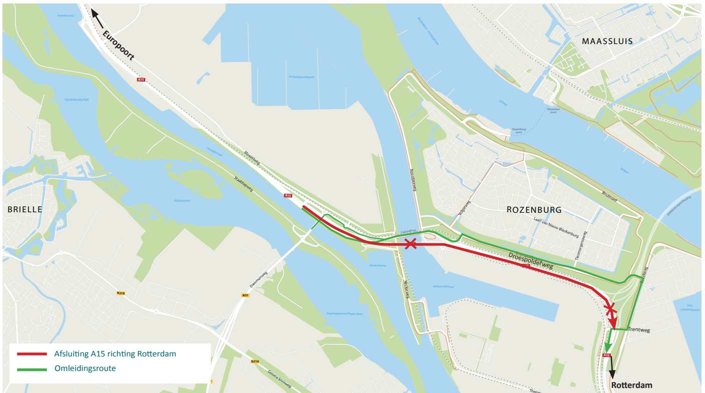
Afbeelding 4 Afsluiting A15 richting Rotterdam tussen Thomassentunnel en Trentweg van vrijdag 8 november 21:00 uur tot zaterdag 9 november 09:00 uur