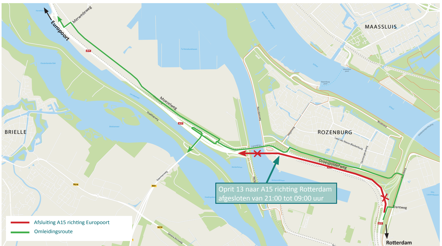
Afbeelding 5 Afsluiting A15 richting Europoort tussen Trentweg en Thomassentunnel van vrijdag 22 november 21:00 uur tot zaterdag 23 november 09:00 uur

BAAK legt in opdracht van Rijkswaterstaat de Blankenburgverbinding aan. De nieuwe weg verbindt de A15 en de A20 tussen Rozenburg en Vlaardingen en verbetert de bereikbaarheid van de bedrijven in het Rotterdamse havengebied en in Greenport Westland.